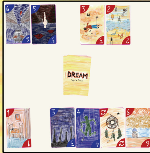
Esempio di gioco